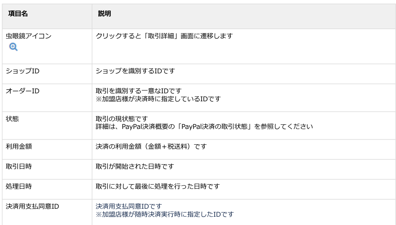
表 取引一覧表示項目