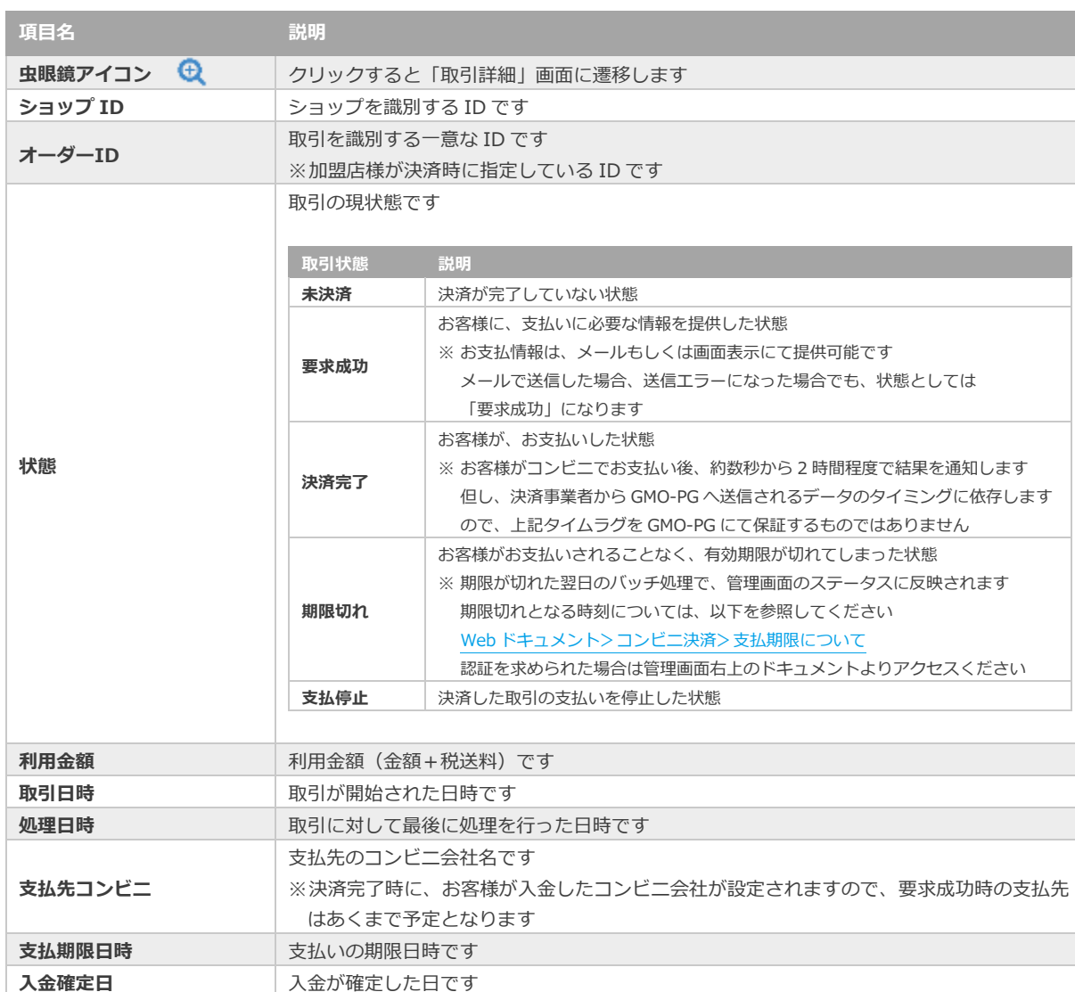
表 3.1-2 取引一覧表示項目の説明