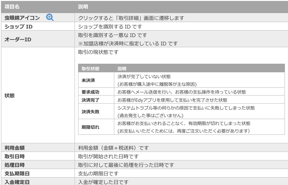
表 2.1-2 一覧項目の説明