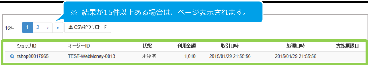
表 2.1-2 取引一覧表示項目