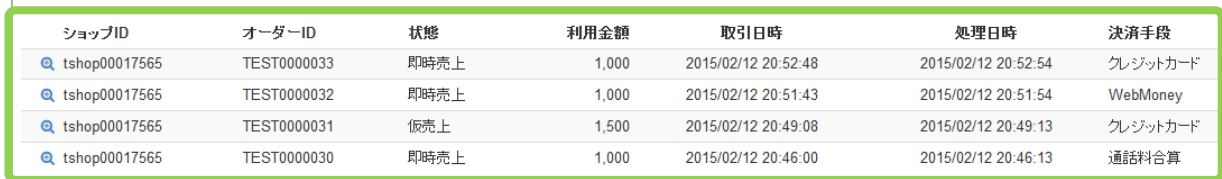
表 2.1-2 取引一覧表示項目の説明