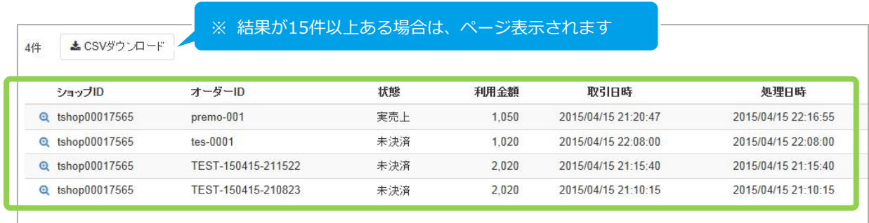
表 2.1-2 取引一覧表示項目の説明