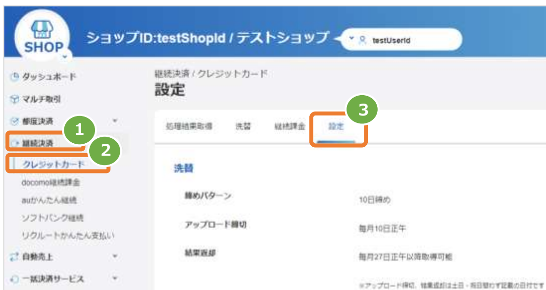
表 5.1-1 洗替・継続課金設定項目の説明