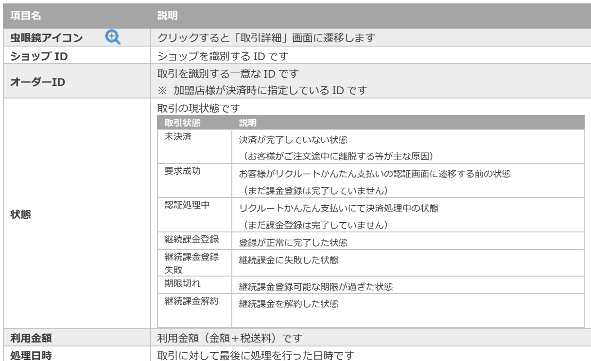
表 2.1-2 取引一覧表示項目