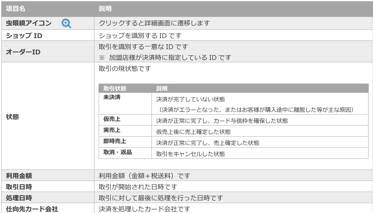
表 2.1-2 取引一覧表示項目