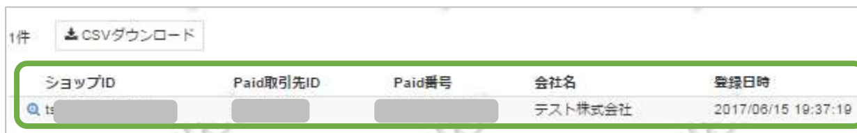
表 5.1-2 取引先一覧表示項目の説明