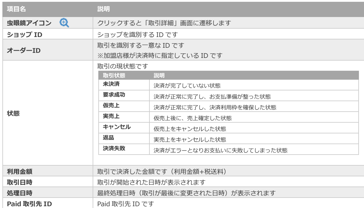
表 3.1-2 取引一覧表示項目