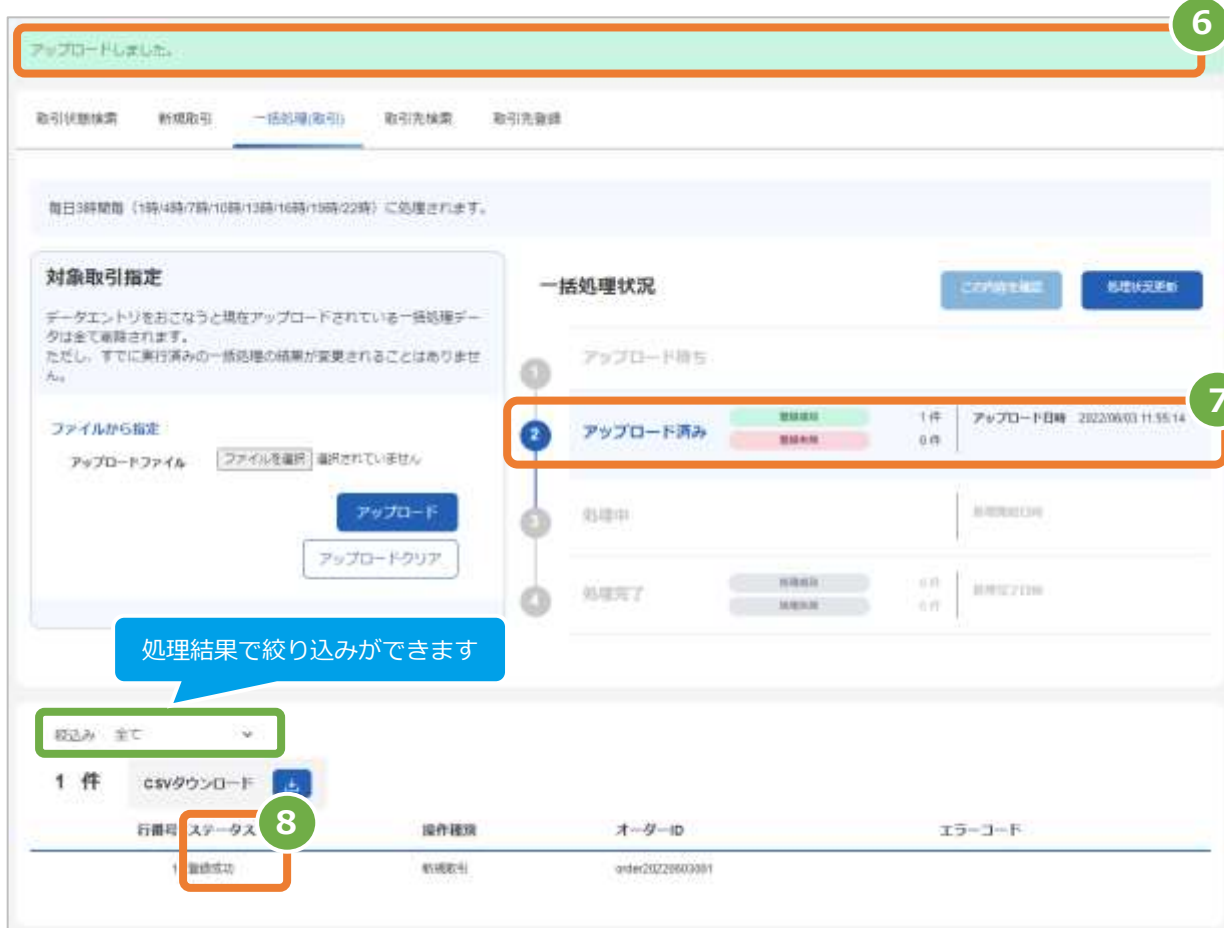
表 5.1-1 一括処理状況の説明