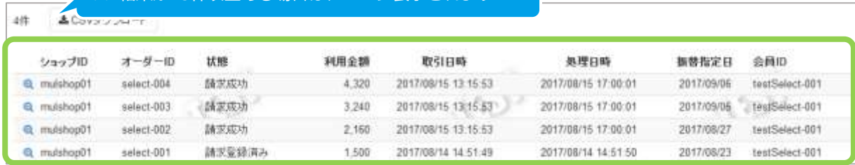
表 4.1-2 取引一覧表示項目