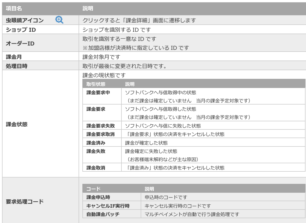
表 4.1-2 課金検索条件の説明