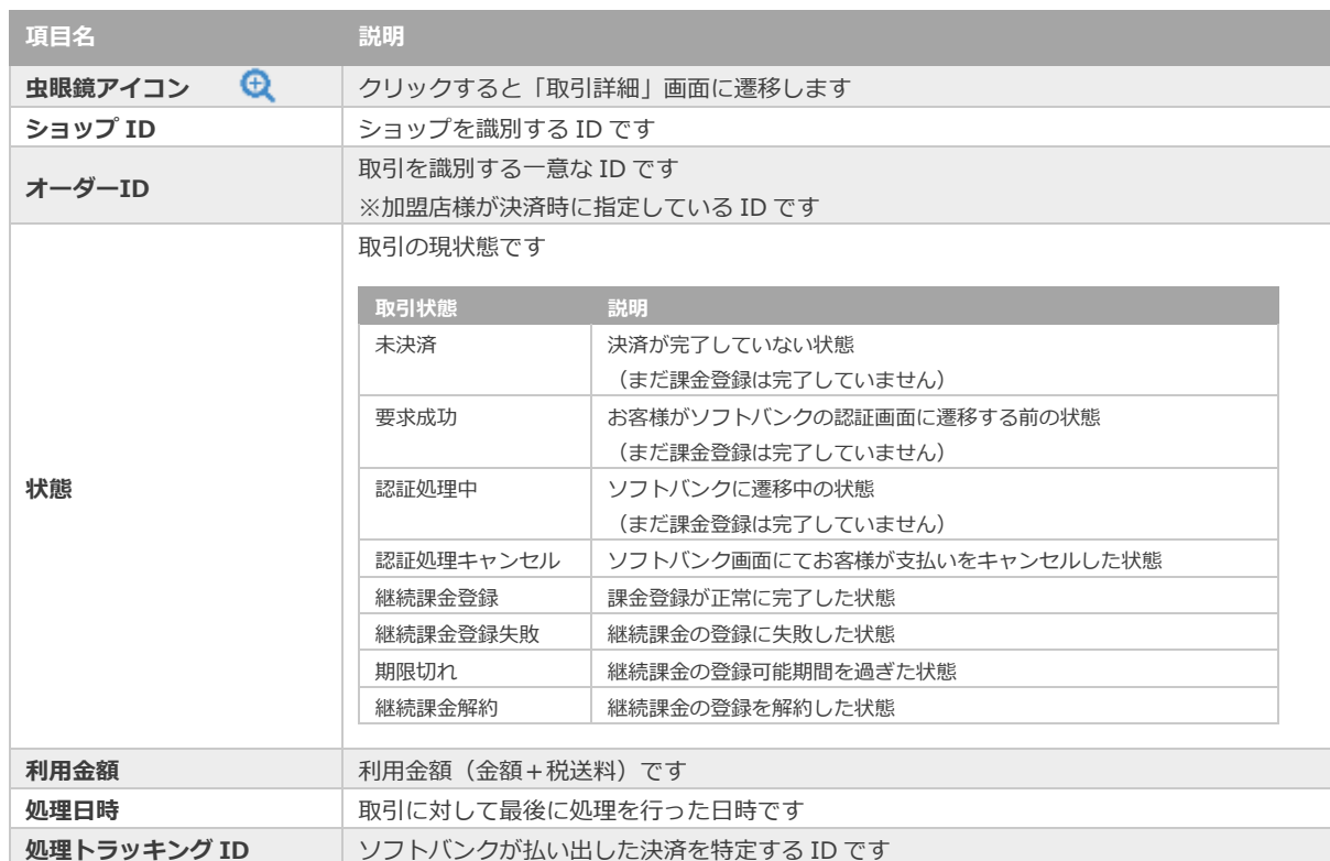
表 2.1-2 取引一覧表示項目