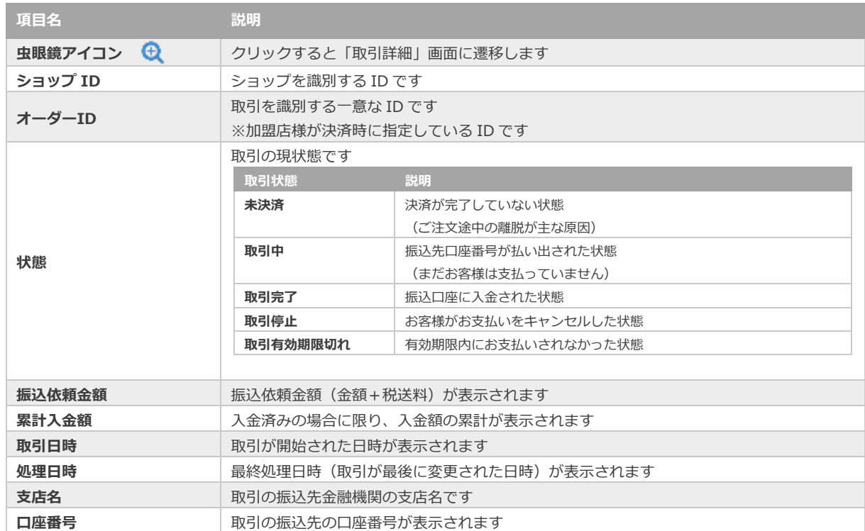
表 2.1-2 取引一覧表示項目