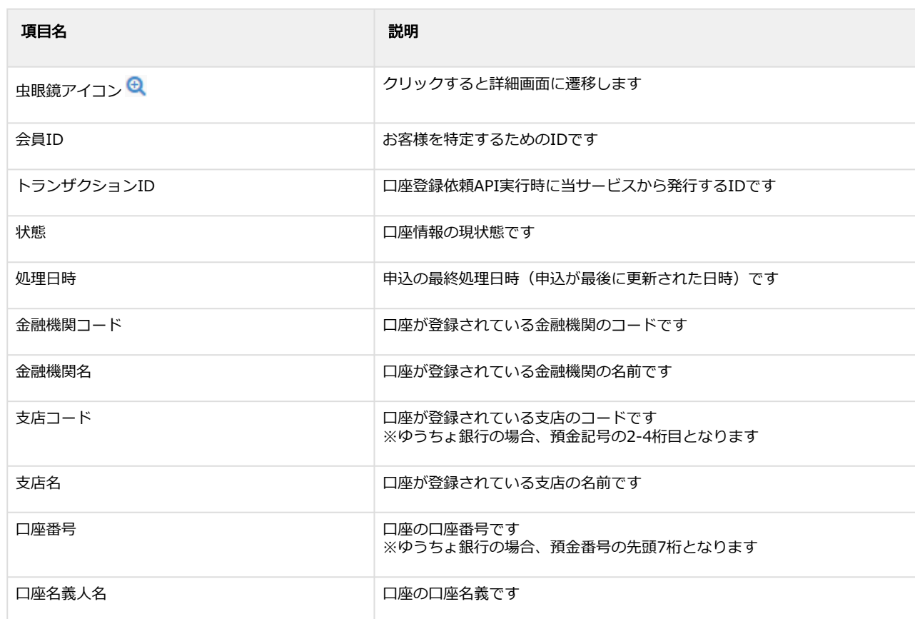
表 申込情報一覧表示項目