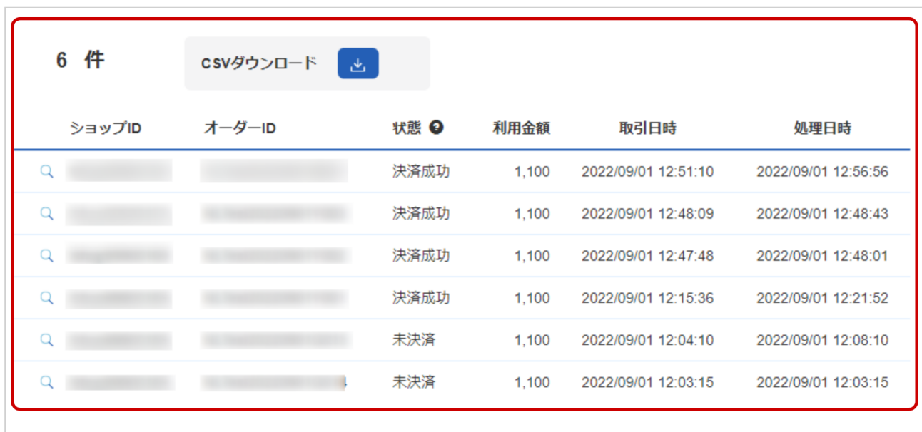
表 取引一覧表示項目